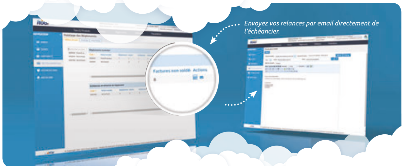
Envoyez vos relances par email directement de l'échéancier.